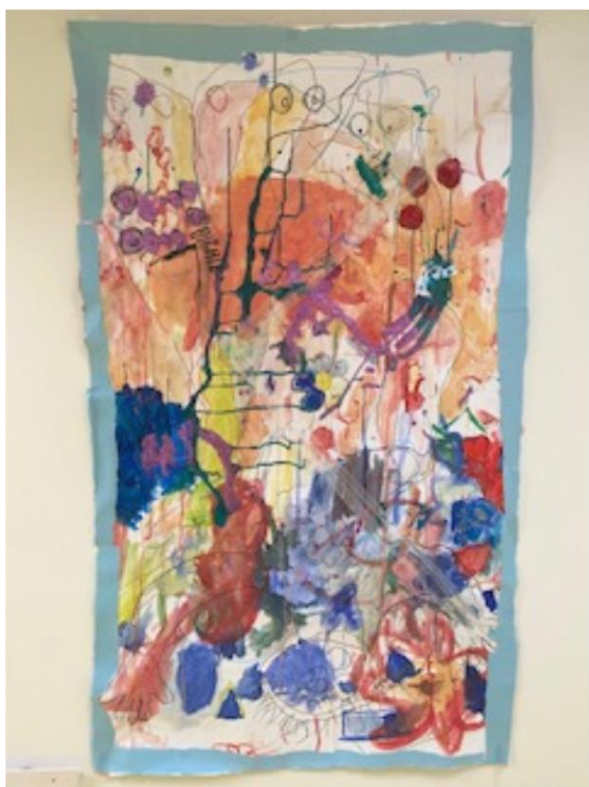
Fællesbillede malet af børnene på Krystalstuen januar 2021.